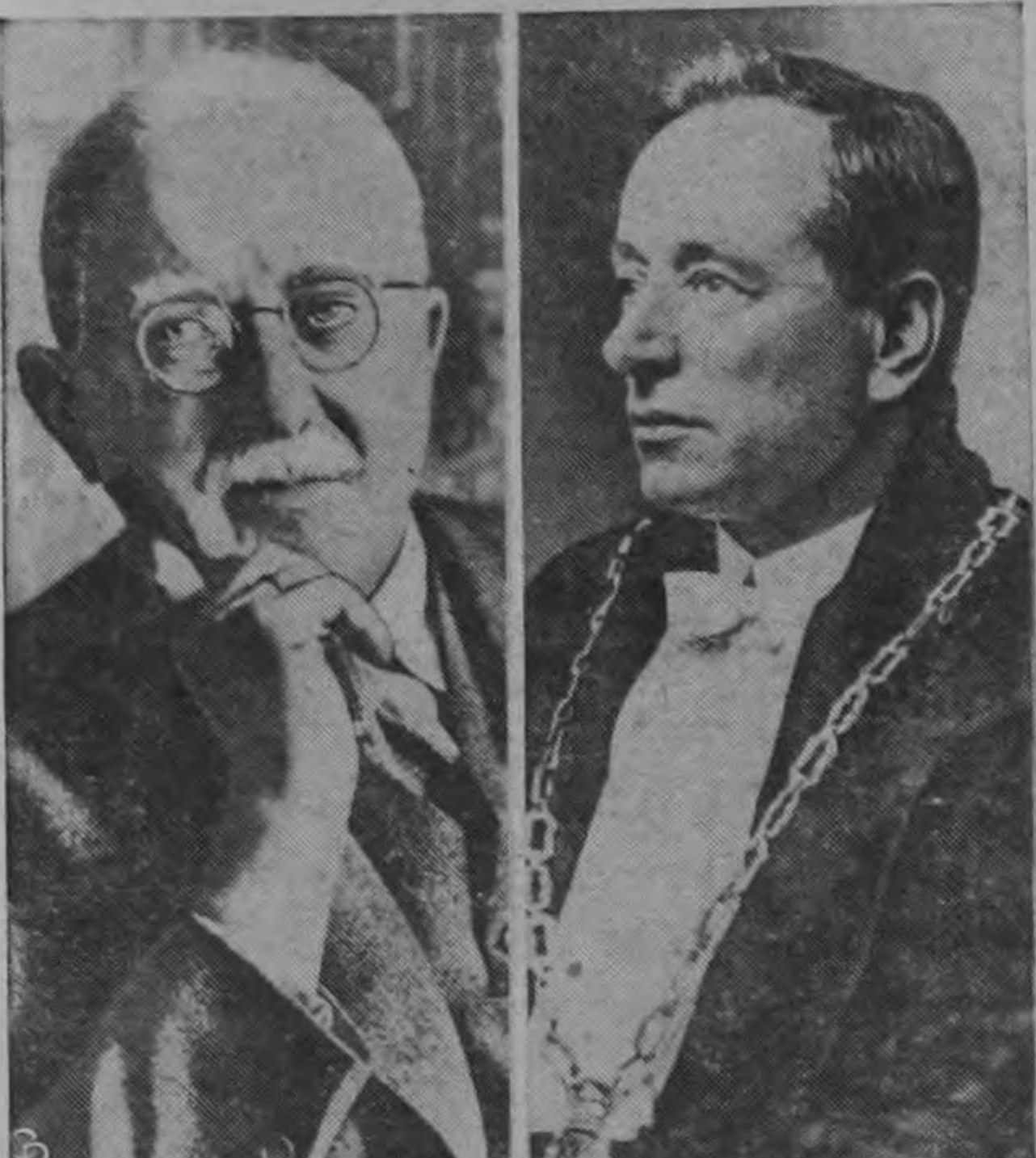
El Profesor Herman Staudinger (izquierda), de Alemania, es el ganador del Premio Nobel de Química de 1953, según un anuncio hecho en Estocolmo. El Dr. Fritz Zernike (derecha), de Holanda, es el ganador del Premio de Física. El Profesor Staudinger fué seleccionado por sus estudios en macromoléculas (grupos de moléculas). El Dr. Zernike recibió el honor por su trabajo en el campo de la física electrónica.