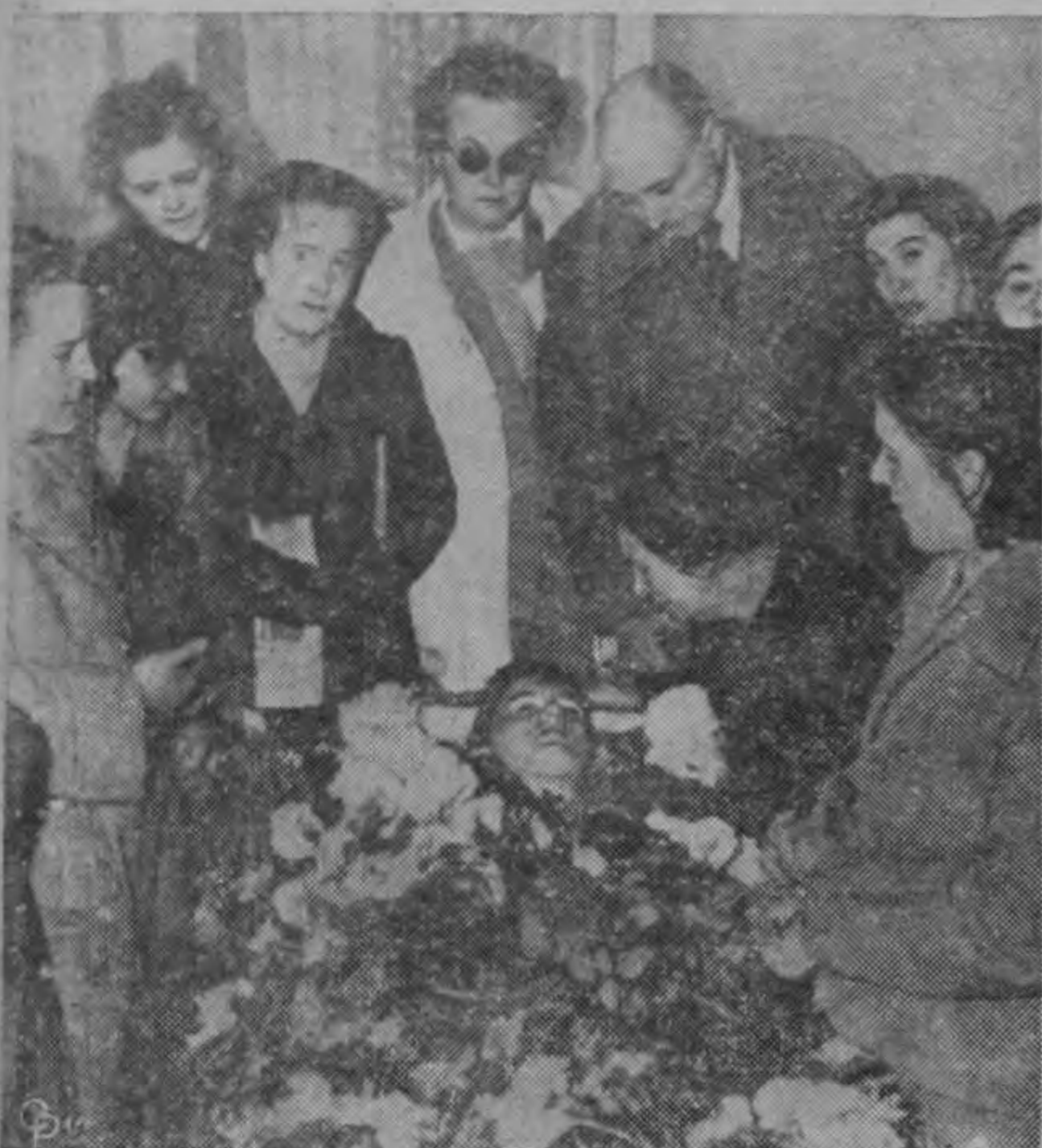
Los familiares anenados rodean al cadáver de una de las víctimas de los motines en Trieste, donde seis personas perecieron durante las manifestaciones y choques con la policía. Los Estados Unidos han rehusado toda responsabilidad por las muertes de siete italianos muertos en recientes amotinamientos, confirmando plenamente su confianza en el Comandante de la Zona y los oficiales del gobierno militar y en su capacidad para "el desempeño de sus responsabilidades".

-Para PAPEL TAPIZ el CICLO CLUB, Tel. 2388-