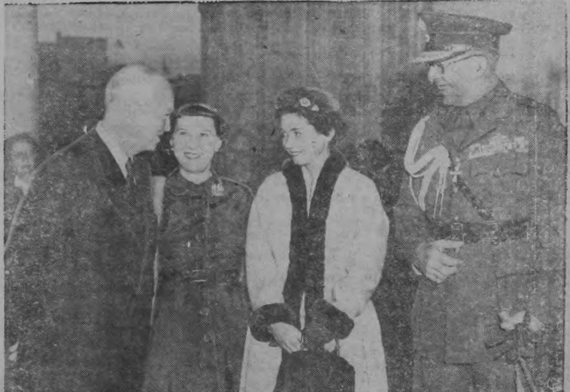
LOS EISENHOWER RECIBEN A LOS REYES DE GRECIA.— El presidente Eisenhower y su esposa dan la bienvenida al Rey Pablo y a la Reina Federica de Grecia en la Casa Blanca, donde estos últimos hospedaron. La pareja real pasará quince días en los Estados Unidos.