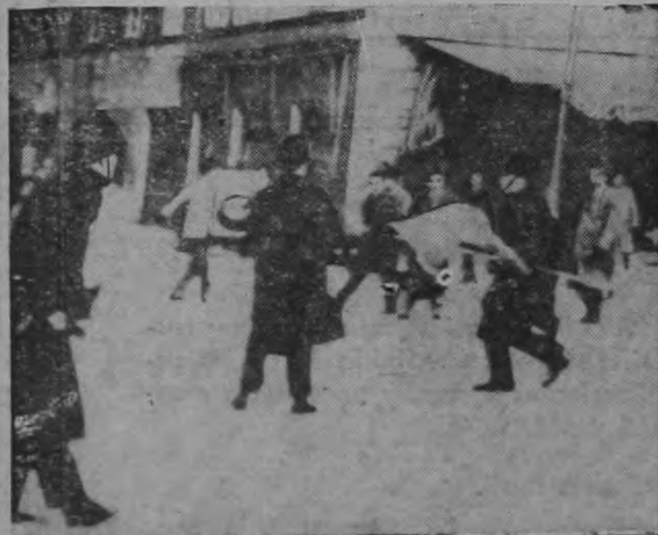
LA POLICIA DE TRIESTE se lleva una bandera italiana capturada a rabiosos manifestantes, durante uno de los disturbios recientes, que tuvieron un saldo de 10 muertos.

MONTREAL, 12. (INS) — El campeón mundial de la división ligera del boxeo Jimmy Carter declaró hoy que le complacería le dieran oportunidad de optar por el simbólico cinturón de la división welter que actualmente ostenta Kid Gavilán.