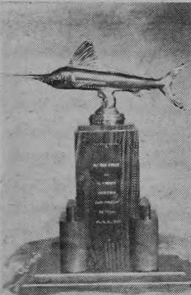
TROFEO REPUBLIC TO-BACCO CO., donado para la Filial de Limón del Club Amateur de Pesca, para ser disputado en la sexta competencia marítima en el capítulo de Cuerda de Mano.